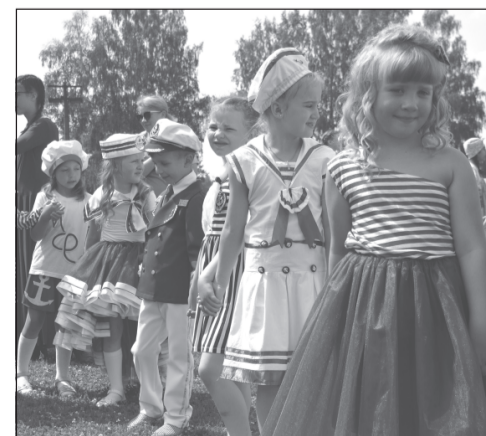
Дошколята на «Регате»