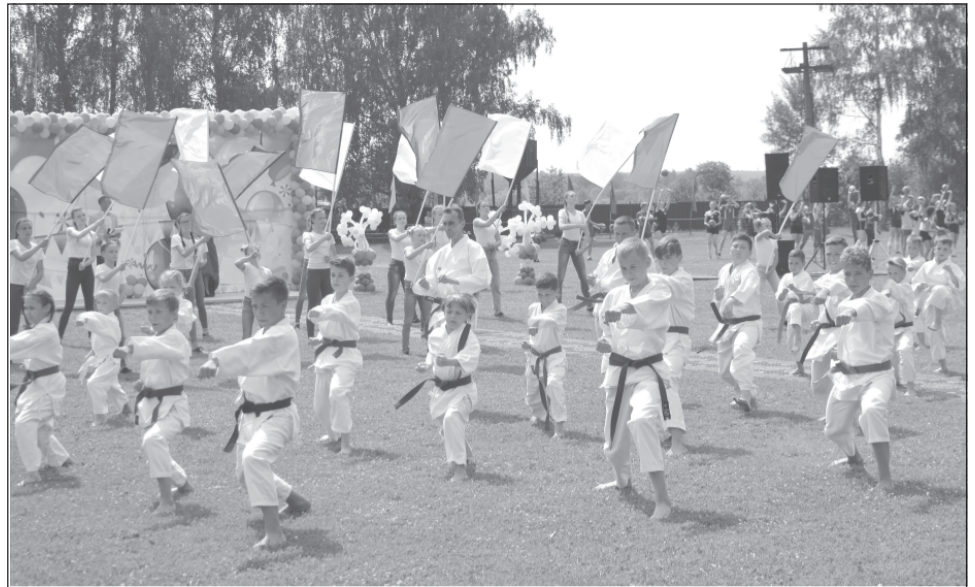
Таким шумным и многолюдным был День города в прошлом году