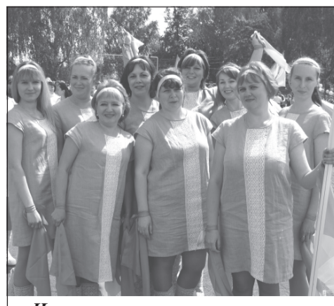
Наши льняницы умеют прекрасно работать и хорошо отдыхать.