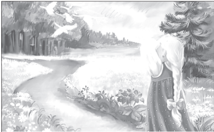
Спасибо тебе, волшебная уточка!

Лера села на берег и стала наблюдать за Егором. Ей стало жалко мальчика, и она подумала, как было бы хорошо, если бы он поймал большую рыбу. И вдруг поплавок качнулся, и Егор вытащил огромного карася! Мальчик обрадовался. Лера подумала, что Егору было бы еще радостнее, если бы у него были новая одежда и сапоги. Не успела она так подумать, как у мальчика вместо рваной и грязной одежды появилась новая.