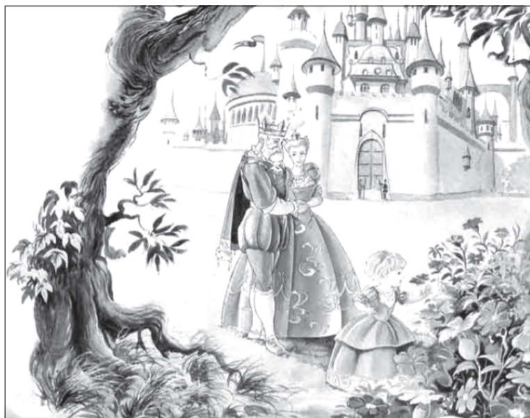
Пусть счастье не покидает ваш дом

И крикнул царь: «Выходи, чудилище, на равный бой! Хочу с тобой сразиться в честной схватке!» Услышал Змей Горыныч, вышел из пещеры и говорит: «Вижу, хороший ты царь, справедливый и отважный! Раз ты и твоё войско не напали на меня спящего, предлагаю я вам не силой помериться, а умом! Если отгадаешь мою загад-