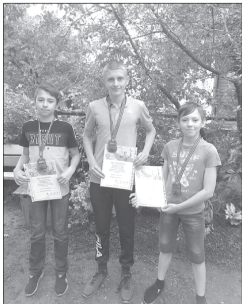
Приволжские гиревики почтили память дедов