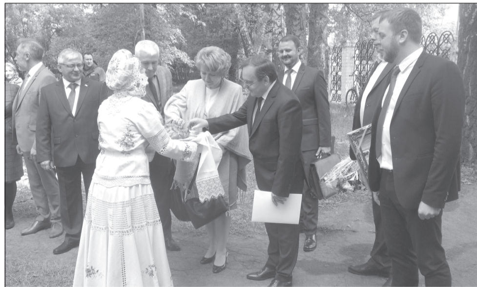
Дорогих гостей встречаем хлебом - солью

А мы предлагаем жителям Приволжска вспомнить, как проходили праздничные мероприятия в недавнем прошлом.