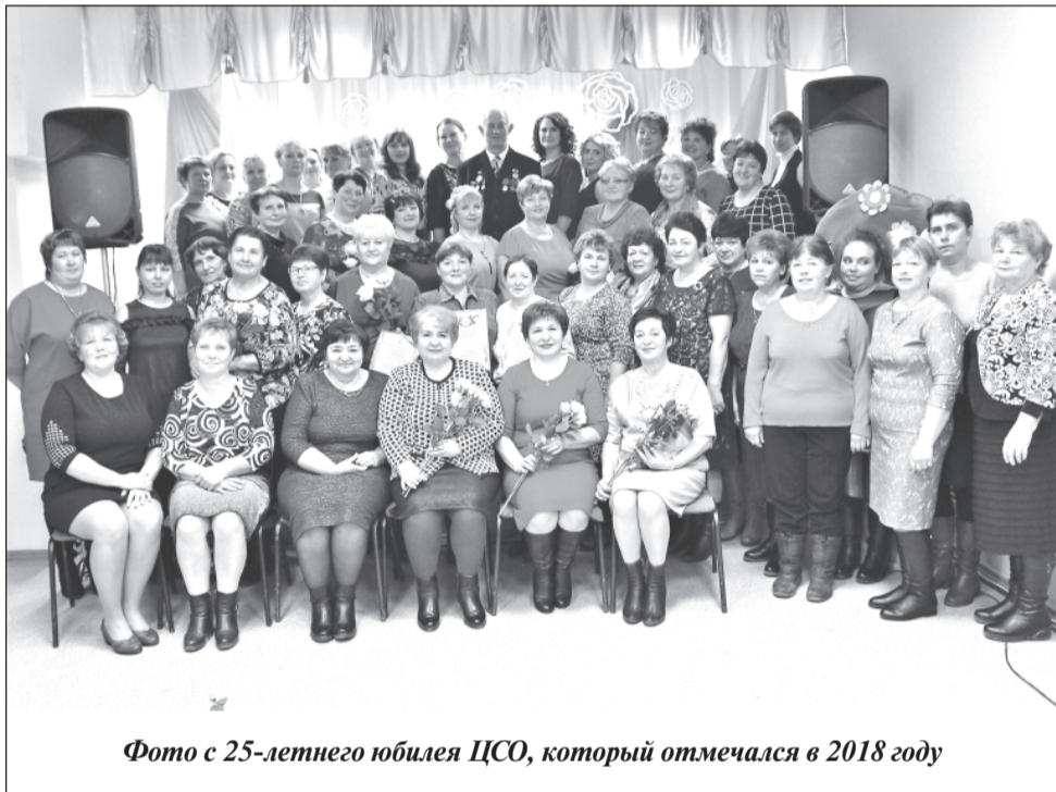
Фото с 25-летнего юбилея ЦСО, который отмечался в 2018 году

Учреждение приняло участие во Всероссийском конкурсе соцпроектов и получило от Благотворительного фонда Елены и Геннадия Тимченко грант в сумме 193 850 руб. Используя эти средства, ЦСО планирует